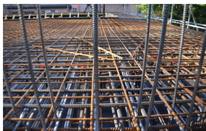
Bauzustand Juli 2018