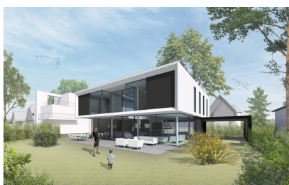
Einfamilienhaus Rostock Grafik: A. Rostock