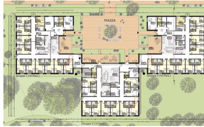
Grafik Multiplan BauplanungsgmbH