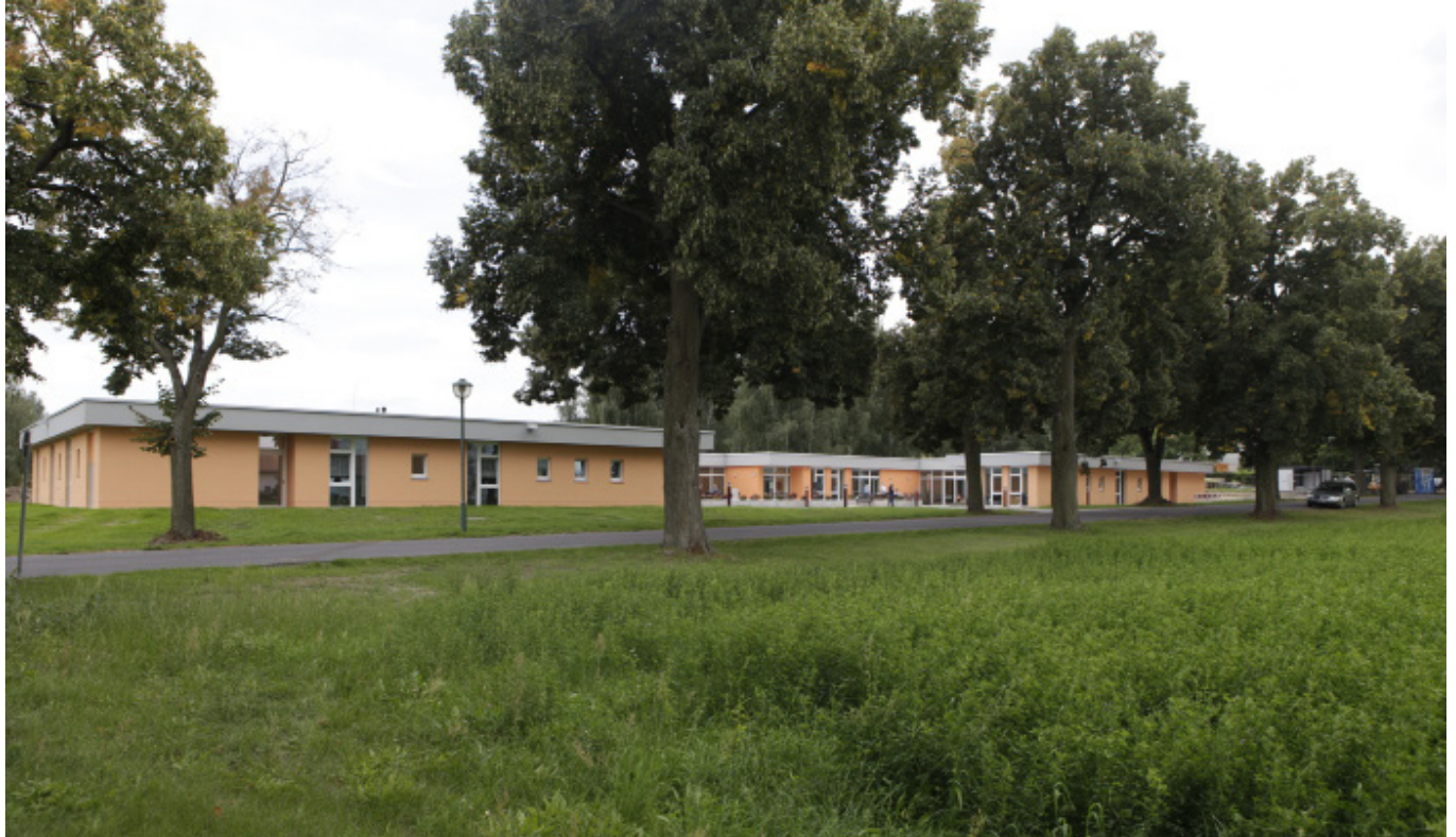
Neubau von 3 eingeschossigen Wohngruppen